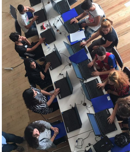
Εικόνα 2: Οι μαθητές την ώρα μαθήματος

Το λογισμικό, το περιεχόμενο, όλες οι εφαρμογές καθώς και τα ρομπότ είναι διαθέσιμα με άδειες ανοιχτού λογισμικού και τα ρομπότ μαζί με τμήματα τους που τυπώνει ο κάθε μαθητής στον τρισδιάστατο εκτυπωτή τα παίρνουν οι μαθητές με την ολοκλήρωση των μαθημάτων για να τα προγραμματίζουν με τα κινητά τους.