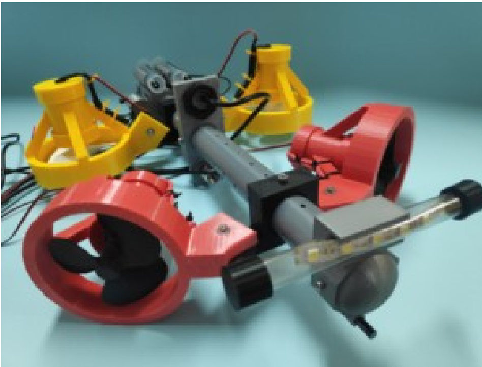
Sea Guard από το 1ο ΕΚΦΕ ΗΡΑΚΛΕΙΟΥ ΚΡΗΤΗΣ